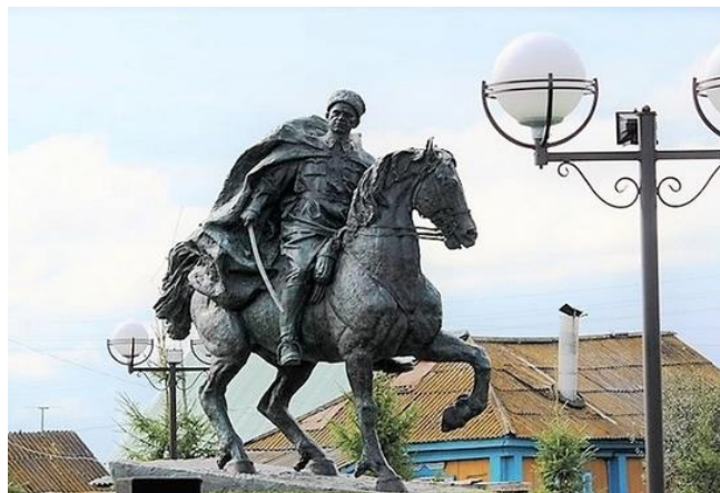
Памятник комдиву установлен в родном селе в Кармаскалинском районе Башкортостана