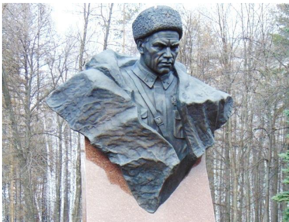
Бюст героя установлен в Уфе в парке Победы

достойно в стране, которой они будут гордиться. Дорогие друзья, я хочу еще раз поздравить всех с праздником и сказать вам просто человеческое спасибо», — заключил временно исполняющий обязанности главы ДНР Денис Пушилин.